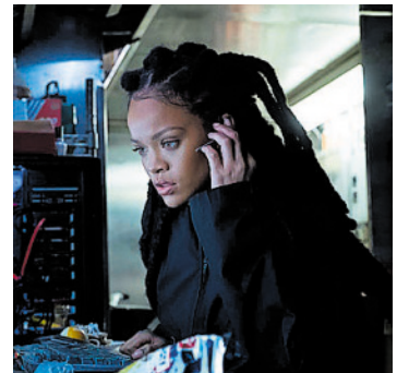
Rihanna in de actiekomedie Ocean's 8 (morgen, Net5, 20 uur).

Misdaadkomedie – (VS, 2007) Met Brad Pitt, George Clooney, Al Pacino. Danny Ocean haalt de mannen bijeen voor een derde overval, nadat casino-eigenaar Willy Bank een van de oorspronkelijke elf, Reuben Tishkoff, heeft verraden. Net5, 21.50 uur